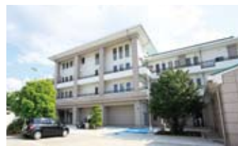
山形市の町中にある施設だからこそ、地域に根ざし、ご家族の方々が通うのにも便利である。