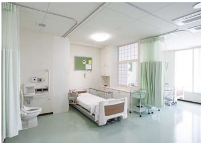
4床室のベッドサイドトイレ。ベッドの手すりを動かして、トイレへと移乗できる。状態が悪くなればベッドをトイレに近づける。一人ひとりのトイレだから、感染対策になるという側面もある。

今は「こまくさ方式」が、おむつ問題や転倒事故に、また残存能力の抽出に対しても有効なことを知っています。心の不安を取り除くことから始めましょう。そして「マイ・トイレ」と言えるまでにベッドサイドをデザインする役目が、私たち設計者には課せられていると感じます。