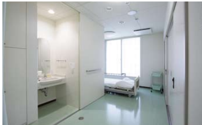
個室ではカーテンとスライド扉を併用し、入口近くに洗面台を設置している。