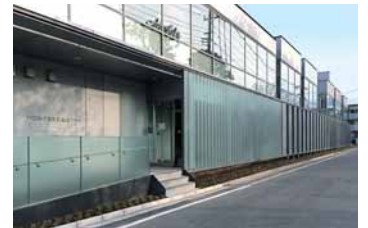
新しくなった市民医療センター。1971年に建設された旧市民医療センターが生まれ変わった。