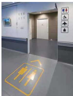
メッセージが直感的に伝わる、シンプルで誰にでも分かりやすいサイン。