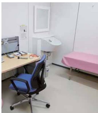
外来のすべての診察室には、水はねが少なく使いやすいスタッフ用洗手器が設置されている。

新しい診療棟の大きな特徴は、誰にでも分かりやすく使いやすいこと。トイレもサインを、壁、突き出し、床の3カ所に設け、壁や突き出しのサインには厚みをつけて視認性を高めるなど、利用者のことを考えた優しい工夫が施されています。