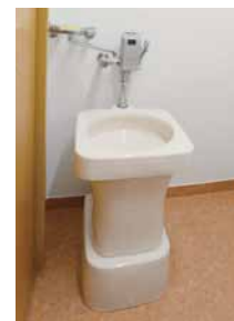
2Fに設置されたセンサー式の汚物流し。