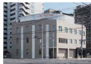
30年以上の歴史ある診療拠点が新築された。

広島「はしもと胃腸科内科」は、1982年の開業以来、地域の人々の支えになってきました。その病院の建て替えを行い、名前を「はしもと内科」に変更するとともに2015年3月より、19床の有床診療所として新しくスタート。1Fは診療フロア、2Fがデイサービス「ささゆり」、そして3Fが入院フロアとなっています。入院もできるようになった地域の「安心拠点」は、在宅生活の支援も行いながら、患者さんのご家族をも支える心の拠り所になろうとしています。