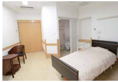
3F入院フロアの個室。8角形のトイレ・シャワーユニットはコンパクトで、ストレッチャーがスムーズに搬入出できる。