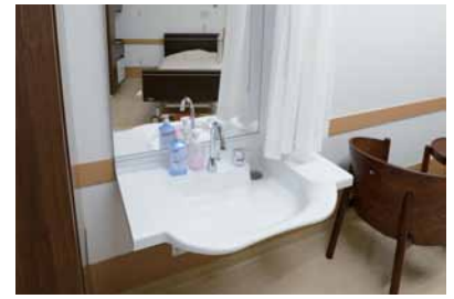
車いすでも使いやすい個室の洗面カウンター。夜に自分の姿を見て驚く認知症の患者さんのためにカーテンを設置。