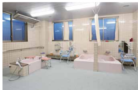
デイサービスの浴室には3つの個浴槽を用意。床には光触媒効果でぬめりを抑え滑りにくいハイドロテクトタイルを採用している。