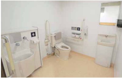
1Fに設けられた、オストメイトにも配慮した多機能トイレ。背もたれや跳ね上げ手すり、L型手すりなどが設けられている。