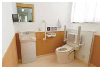
デイサービスの車いすトイレでは、座位の安定をはかる背もたれ付きアームレストを採用。

また、入院病棟のスタッフステーションから病室全体が見渡せるように設計されるなど、スタッフがいつでも患者さんをサポートできる配慮が行き届いています。