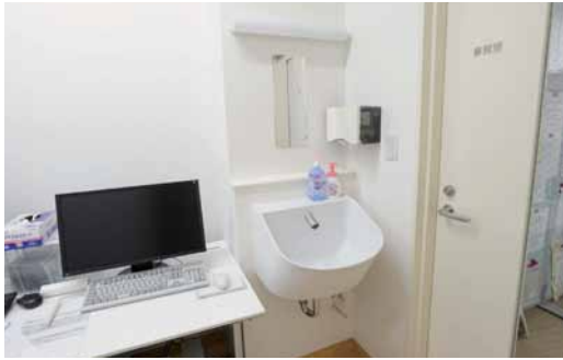
1F診察室と事務室の奥に設けられたスタッフ用手洗器。