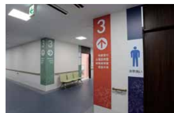
見やすきはっきりとしたサイン計画を展開。

トイレは、事前にモックアップで確認して、スタッフ全員で手すりやスイッチの位置などの細かい寸法まで検討。感染対策のスタッフからの進言で、大便器や小便器、手洗いカウンター、汚物流しには壁掛けタイプを採用し、さらにパブリックトイレには積極的に非接触のセンサー式を導入しました。また、加圧ポンプや排水ポンプが非常用発電機の回路に組み込まれているので停電時にも使用できるトイレを用意するなど、災害対策にも配慮されています。