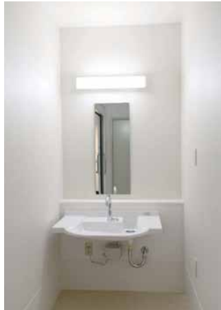
4床室の洗面カウンターは、カウンター横に入って介助ができるように、片側に十分なスペースを確保。また、カウンターの側面もしっかりと清掃できるよう、あえて壁との間に隙間を設けて設置している。