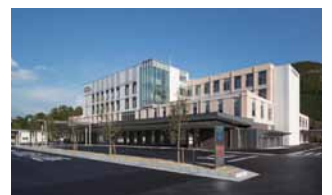
4階建ての新病院は、総床面積も大幅に拡大。

同じ大台町には、老健施設を中心とした宮川メディカルセンターも新たに開設。住み慣れた土地で、安心して暮らし続けられる取り組みが進められています。