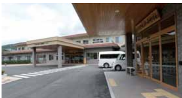
「介護老人保健施設みやがわ」には、デイケアセンターも併設。この左側には「報徳診療所」が開設されている。

老健施設には個室60室と4床室10室があり、1Fにはデイケアも。自宅との橋渡しになるためにも、利用者が自宅にいるような感覚で自分のペースで暮らせるように配慮され、リハビリにも独自開発のプログラムによる工夫がなされています。