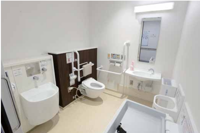
1Fに設けられたオストメイト対応の多機能トイレ。清掃のしやすさも考慮し、大便器には壁掛けタイプを採用している。ペーパーチェアやおむつ交換台なども用意されている。