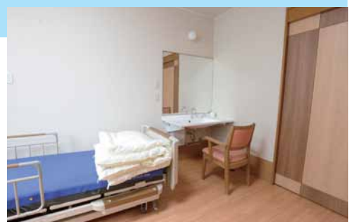
個室には、車いすでアプローチしやすい洗面カウンターを設置。入口扉は木でデザインされ、和やかな雰囲気を醸し出している。