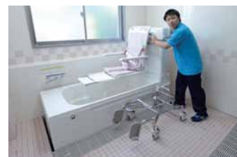
各階には機械浴室も設けられ、1Fではリフトで入れる介護浴槽を採用している。

浴室などには、利用者はもちろん介助者の負担も軽減するような工夫がなされ、安心・安全をサポート。手すりなどによってスムーズに利用できるアプローチにも配慮されています。