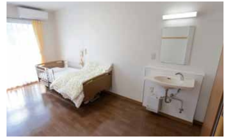
ユニットの個室。センサー式の手洗器は、すぐに湯が使えて快適に利用できるように電気温水器付きになっている。