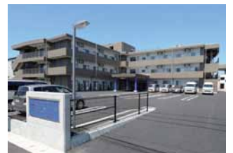
T字型のフォルムが特徴的な3階建ての施設。

2015年5月、新潟市内に開設されスタートした、特別養護老人ホーム くりの木。特別養護老人ホーム、ショートステイ、小規模多機能型居宅介護、グループホームが一体となり、在宅でも入所でも、利用者のさまざまなニーズに合わせて使うことのできる、まさに地域密着型の新しい施設です。慣れ親しんだ地域で、たくさんの人の「とびきりの笑顔」が見られるように充実の施設と細やかなサービスで、暮らしをサポートしています。