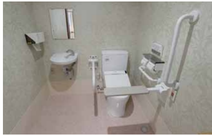
壁紙が柔らかな雰囲気のトイレ。前方アームレストや跳ね上げ手すりなどがあり、縦の手すりは車いすからの立ち上がりにも有効。