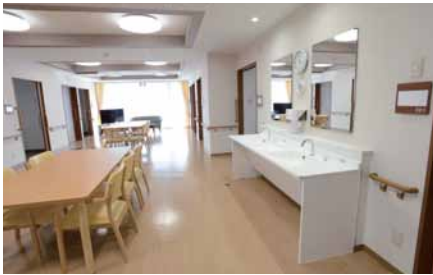
ユニット中央に設けられたホールは、リビング・ダイニングの役割を果たしている。洗面カウンターは車いすでも利用しやすい。