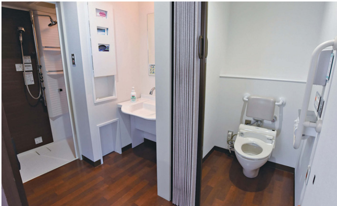
特別室のシャワー、手洗器、トイレ。手洗器の横には感染対策のために、個人防護具の収納棚を設置している。