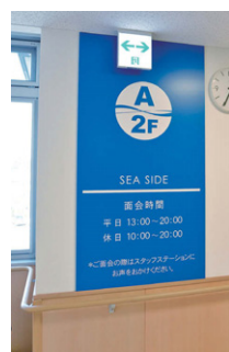
海と山の美しい立地をサインに生かし、海側にはブルーで別府湾、山側にはグリーンで鶴見岳をモチーフにしたデザインを施している。