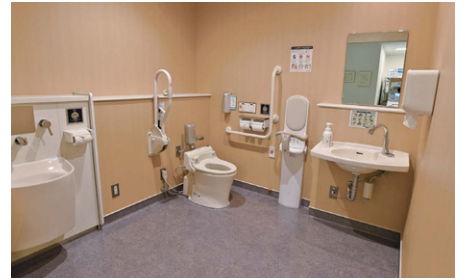
外来に設けられたオストメイト対応の多機能トイレ。ベビーチェアも用意されている。