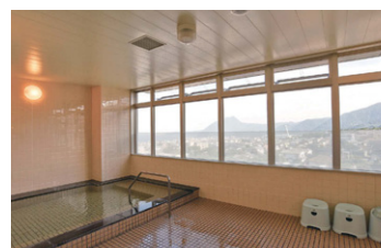
最上階の4Fには、別府ならではの景色と温泉が楽しめる源泉かけ流しの展望風呂を設置。

特徴的な取り組みは、若いスタッフも参加した有志による「カラーコーディネート委員会」。新病棟の海側(A棟)をブルー、山側(B棟)をグリーン、メディカル機能をピンク、診療機能をイエローのエリアカラーにしてサインと連動させるなど、参加型の取り組みによって病院づくりを行いました。サインの施工は、最初からプラスチックで本物を作るのではなく、まず一度紙で作って1か月ほど使用。位置や文字の大きさなどを確認・検討した後に正式なものを製作するという流れで、現場での人の感覚を大切にしています。