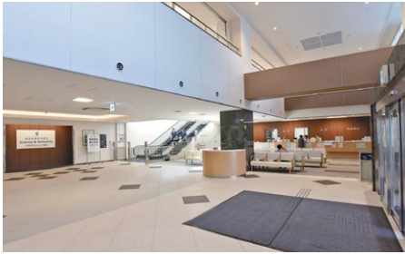
エントランスホールには、病院の理念である「Science & Humanity ~科学する心と人間愛~」が掲げられている。