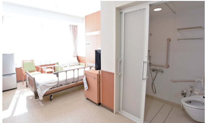
55室の個室のうち10室には、8角形のトイレ・シャワーユニットを採用。これによってベッドのまま患者さんを移動させる際の余裕も生まれている。