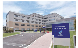
正面玄関の左側に見えるのが新病棟である。

新別府病院は、温泉観光都市・別府市のほぼ中央に位置し、1955年の開院以来、「Science & Humanity」の理念のもと、急性期対応病院として地域医療に貢献してきました。病院創立60周年という節目もあり、足掛け4年にわたるプロジェクトによって、限られた敷地内において既存棟の一部を解体し、新しい病棟を建設。残った既存棟も改修し、新しい病院への大規模なリニューアルを推進しました。休むことなく診療を継続しながら、患者さんのための病棟機能などを充実させています。