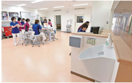
スタッフステーションの出入口には、非接触式のスタッフ用手洗器が設けられている。