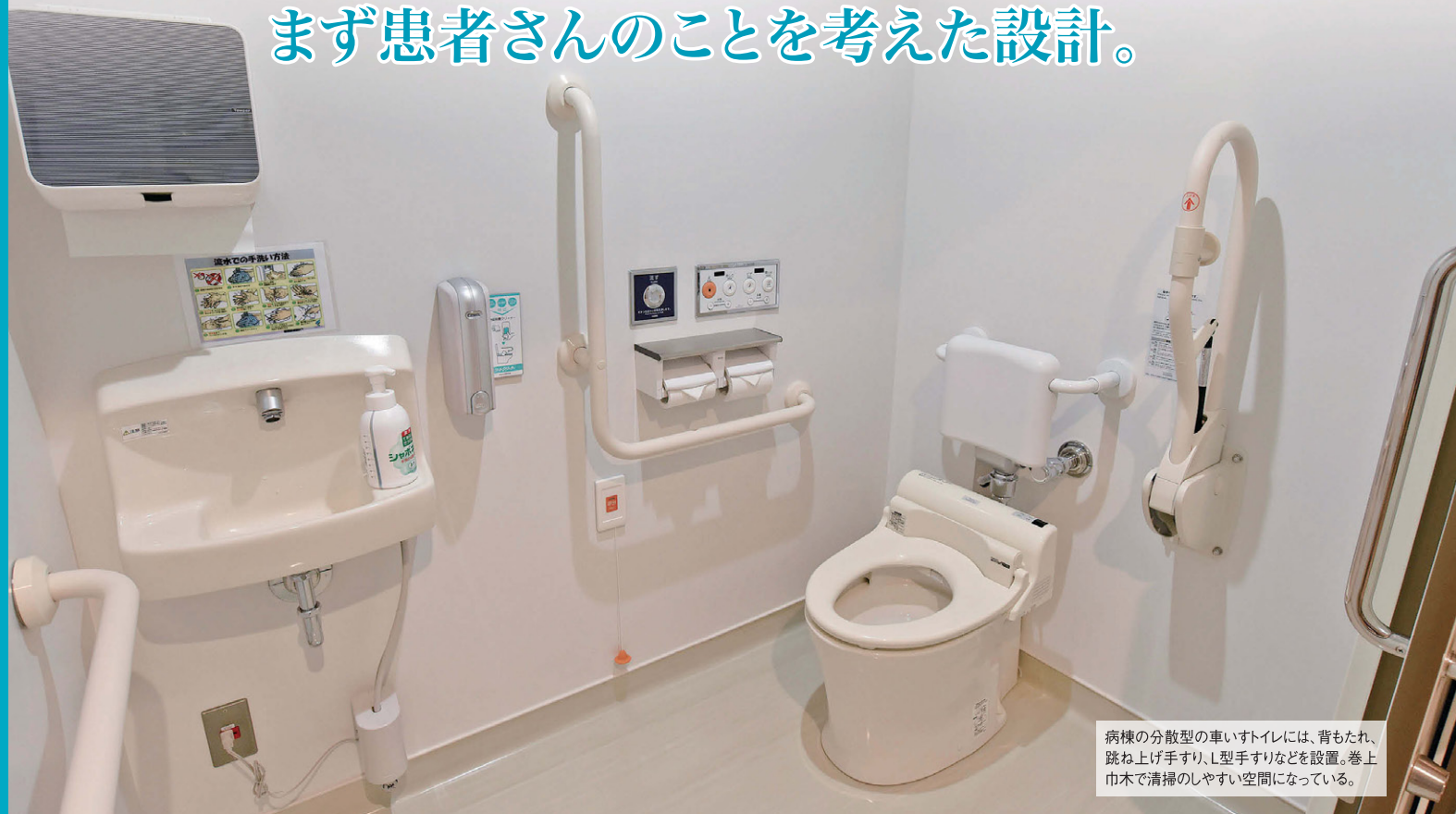
病棟の分散型の車いすトイレには、背もたれ、跳ね上げ手すり、L型手すりなどを設置。巻上巾木で清掃のしやすい空間になっている。

新別府病院は、温泉観光都市・別府市のほぼ中央に位置し、1955年の開院以来、「Science & Humanity」の理念のもと、急性期対応病院として地域医療に貢献してきました。病院創立60周年という節目もあり、足掛け4年にわたるプロジェクトによって、限られた敷地内において既存棟の一部を解体し、新しい病棟を建設。残った既存棟も改修し、新しい病院への大規模なリニューアルを推進しました。休むことなく診療を継続しながら、患者さんのための病棟機能などを充実させています。